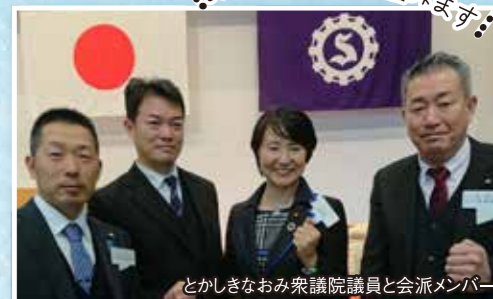
とかしきなおみ衆議院議員と会派メンバー