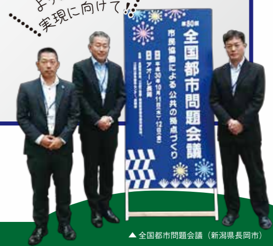
▲全国都市問題会議 (新潟県長岡市)

令和元年はつながりのまち摂津の実現に向けて、会派として各施策にしっかり取り組みます。